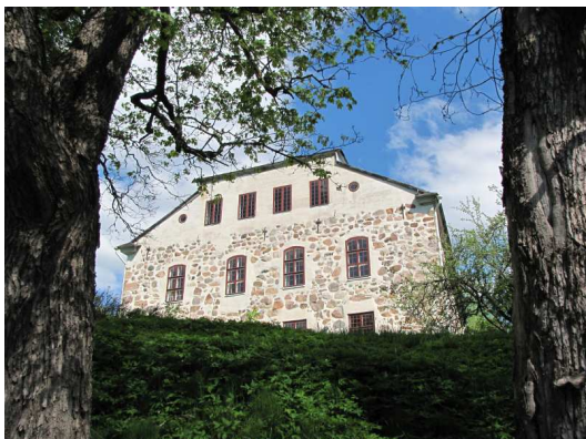
Sjundby slott i Sjundeå.

Efter lunchen besökte vi Sjundby slott i Sjundeå, en imponerande medeltida gråstensbyggnad med ställvis nästan två meter tjocka väggar. Slottet ligger vackert vid Sjundeå å, omgivet av en numera något vildvuxen park. Med Berndt som vår utomordentliga guide fick vi höra om gårdens historia och bekanta oss med de tre våningarna. De ryska texterna på en av uthusbyggnaderna påminde fortfarande