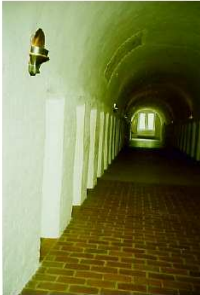
Sovsalen (dormitoriet) i Vadstena klostermuseum. Öppningarna till sovsalarna saknade dörrar.