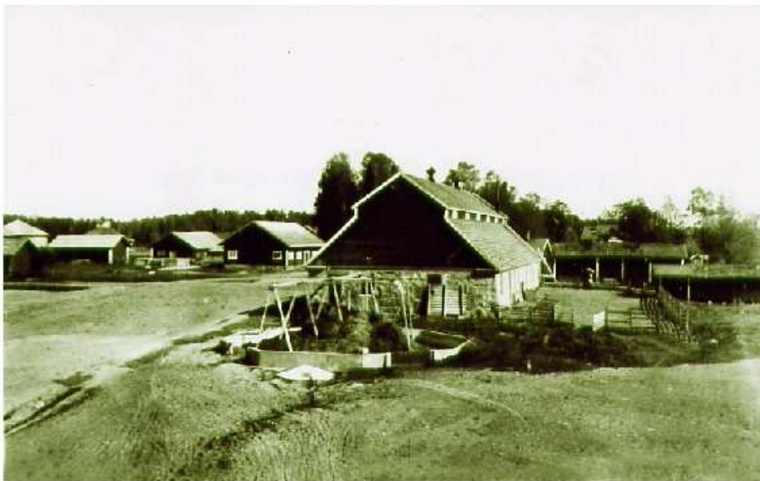
En del av ekonomibyggnaderna på 1920-talet