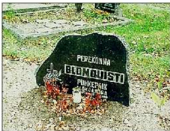
"Familjen Blomquists viloplats" på kyrkogården i Loksa.

På så vis kommer denna unika muntliga tradition att bevaras, till glädje inte bara för Viinistuborna utan också för släkt- och folklivsforskare på denna sidan viken.