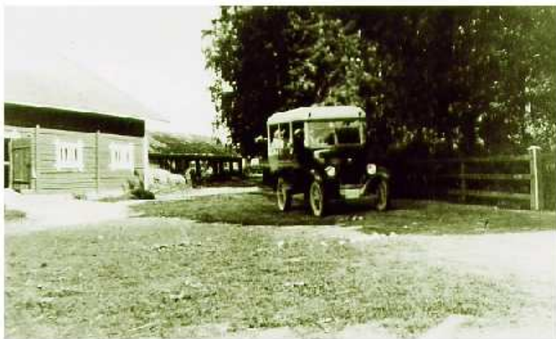
Elever från Högvalla på exkursion till Mickelsböle gård på 1020-talet