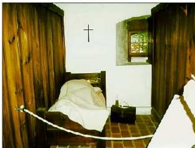
En sovcell i sovsalen (dormitoriet). I varje cell fanns en säng och en liten läsbar kista för kläder. Madrassen var av halm och kudden av läder. Dörrar till cellerna fanns inte, och det var kallt om vintern eftersom man inte eldade i sovsalen.

En modell av hela klosterområdet och alla dess byggnader med örtagård gav oss besökare en god helhetsbild av området. Inne i klostrets kapitelsal fick vi höra mera intressanta fakta. Klostret idkade ingen välgörenhet - efter 30 år var det ett av de rikaste i Europa. Klostret ägde t.ex. 1100-1200 gårdar runtom i riket, endel av dem belägna i Finland. Tyvärr kunde guiden inte uppge namnet på en enda av dem som fanns i Finland. I Vadstena klostrets jordebok finns namnen på alla gårdar, ifall någon av artikelns läsare är intresserad av sådana uppgifter.