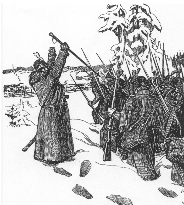
Illustration: Albert Edelfelt